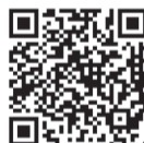
▶ 香港聖公會安老院舍外展專業服務隊Facebook專頁

福利協會期望將「以人為本」、「自立照護」的理念推展至更多院舍，與業界一同邁向「零約束」的願景，讓更多長者能在安全、舒適且富尊嚴的環境中安享晚年。如對計劃有任何查詢，歡迎致電3751 3566，聯絡香港聖公會安老院舍外展專業服務隊。