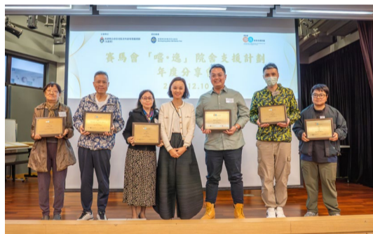
▲ 感謝計劃各合作夥伴出席支持

福利協會期望將「以人為本」、「自立照護」的理念推展至更多院舍，與業界一同邁向「零約束」的願景，讓更多長者能在安全、舒適且富尊嚴的環境中安享晚年。如對計劃有任何查詢，歡迎致電3751 3566，聯絡香港聖公會安老院舍外展專業服務隊。