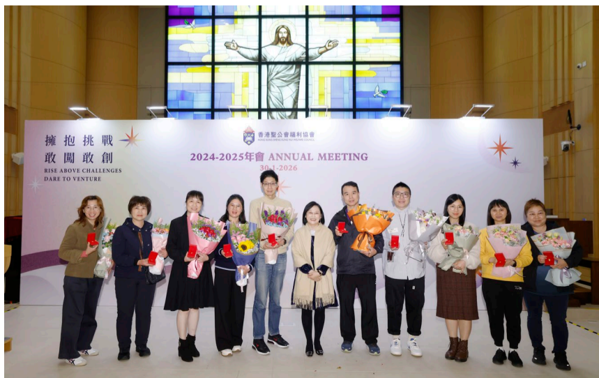
▲ 大會向同工頒發長期服務獎

年會同時舉行長期服務獎頒獎禮，以表揚福利協會、聖基道兒童院及聖雅各福群會同工多年來的貢獻。大會向 526 位同工頒發長期服務獎，其中 17 位服務 25 年、17 位服務 30 年、1 位服務 35 年。