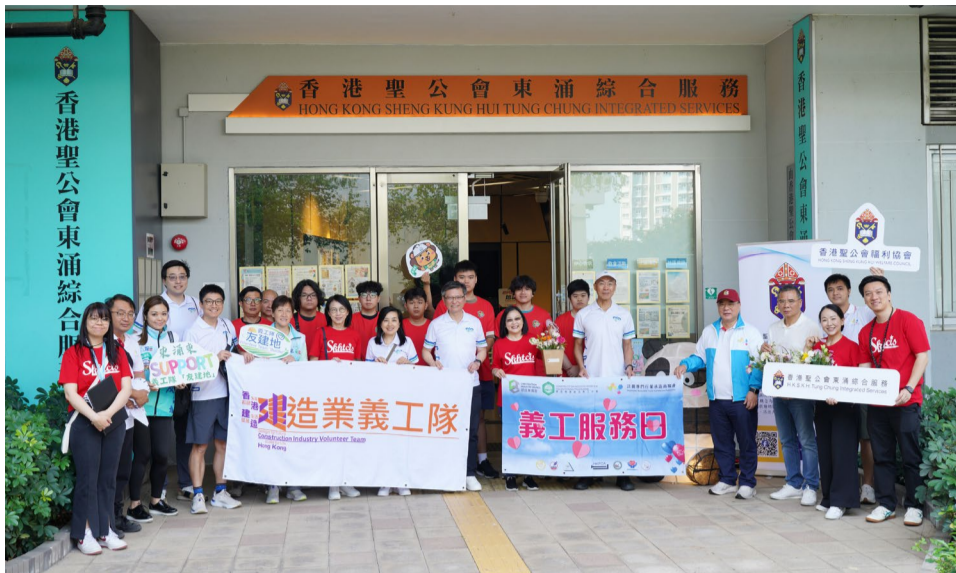
▲ 建造業義工與協會團隊出發探訪前合照

亦安排定期探望及跟進。今次義工到訪李太家中，為他們安裝扶手，減低意外風險；同時送上婦女製作的花籃，點綴新居。跨界別的關心令李太太備受感動，「如果沒有中心和義工，我和老伴真的很徬徨。」