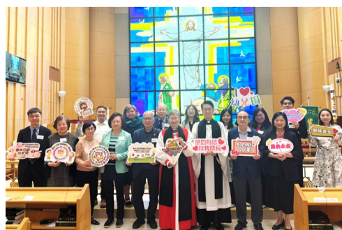
▲ 兩園的校董、牧者、嘉賓合照