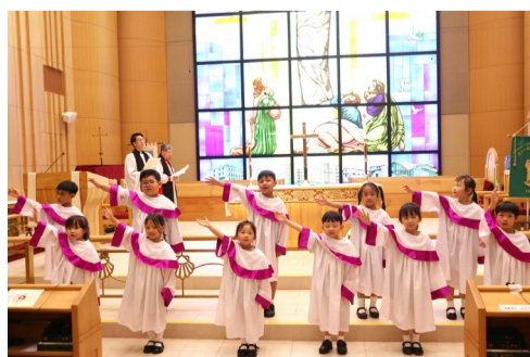
▲ 兒童獻唱詩歌，以美妙的歌聲頌讚天父