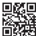
了解香港聖公會東涌綜合服務 ▲

是次義工日，讓建造業義工以自身專長回應居民生活需要，也展現社福界與建造業之間的合作。正如總幹事所言，社福服務猶如生活的「軟件」，協助居民面對生活困難、連結社區資源；建造業則如生活的「硬件」，建地造屋、改善居住環境。兩者彼此配合，既回應實際需要，也讓居民在新社區中感受到關懷與支持，能夠共同推動更有溫度的幸福社區。