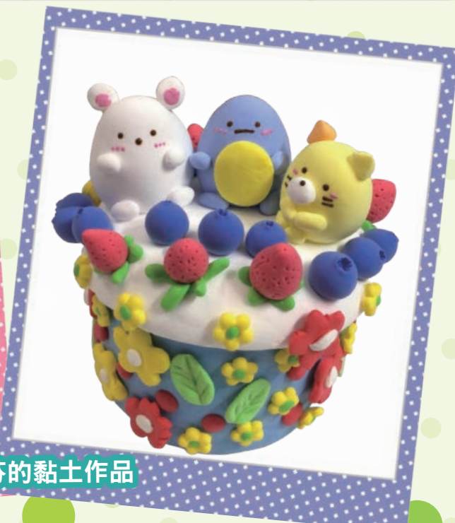
寄養兒童小芬的黏土作品