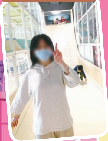
大朋友小朋友都喜愛的大滑梯

7/1/2023 我們在 Megabox 智遊天地 E Cube Club 舉行親生家人活動，當天共有 21 人參加。有家長表示『很難得有機會來這類遊樂場，與孩子玩』，也有孩子樂而忘返，相信家人和孩子都有一個愉快的親子同樂時光。有人喜歡大滑梯，也有人喜歡撞車，那麼，小朋友你喜歡甚麼？