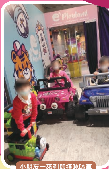
小朋友一來到即揸咪啲車